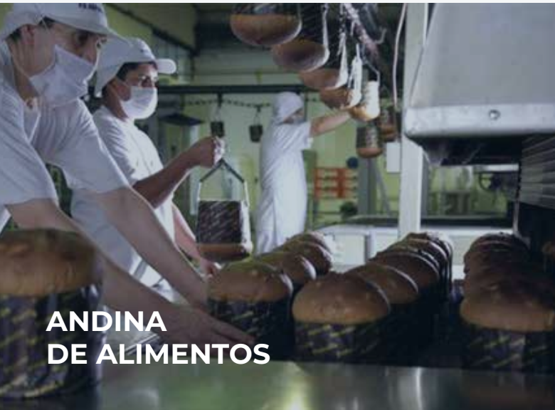
ANDINA DE ALIMENTOS