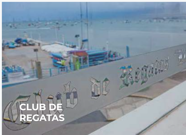
CLUB DE REGATAS